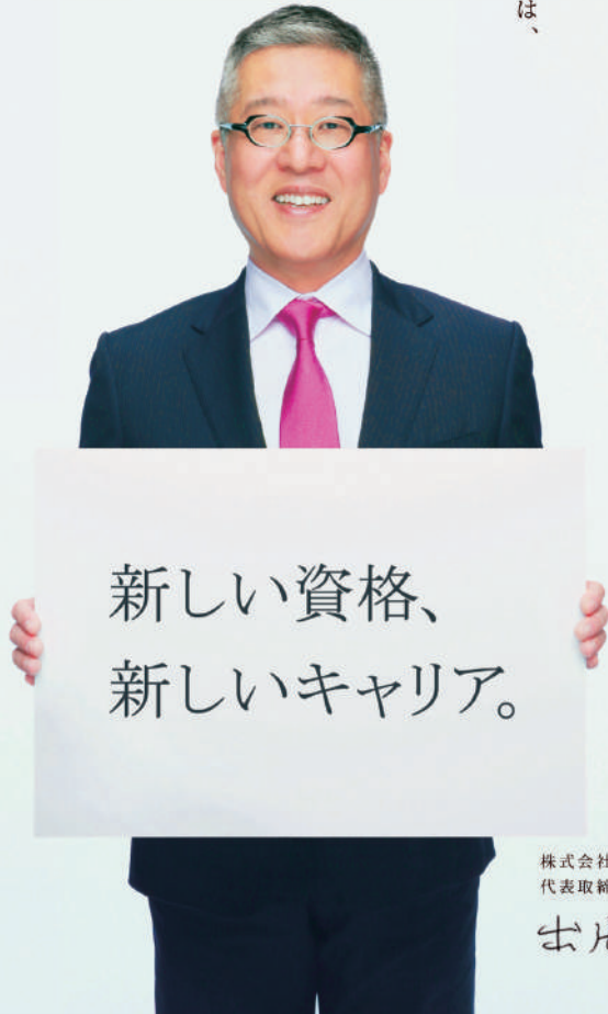
株式会社オデッセイ コミュニケーションズ 代表取締役社長

資格は、その道の専門家たちが、 これだけは知っていてほしいと 考えるところを、 カタチにしたものです。 オデッセイ コミュニケーションズは、 さまざまな分野の 専門家たちと協力して、 時代が必要とする資格を、 皆さんにご提供していきます。 新しい資格を取得することで、 新しいキャリアを、 そして新しい日本を、 切り開いていこうとする人たちが オデッセイ コミュニケーションズは 応援しています。