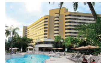
2021年度の決勝の地はフロリダ

2020年4月1日(水)～2021年3月31日(水)の期間内に、MOSまたはACAを受験して合格した方